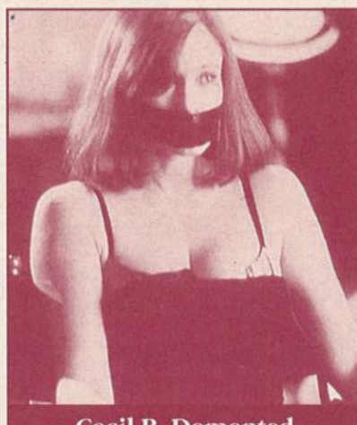
Cecil B. Demented